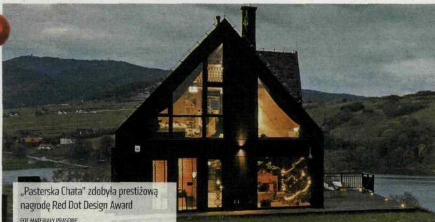
„Pasterska Chata” zdobyła prestiżową nagrodę Red Dot Design Award