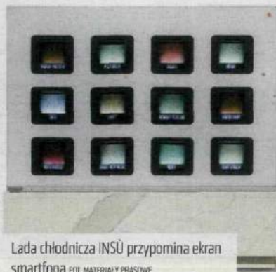
Lada chłodnicza INSU przypomina ekran smartfona

narodowych jurorów. Zaprojektowany przez niego model S3 zdobył bowiem w 2013 r. najwyższe wyróżnienie w konkursie „Red Dot Award: Product Design”.